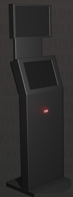
Lecteur code à barre/QRcode