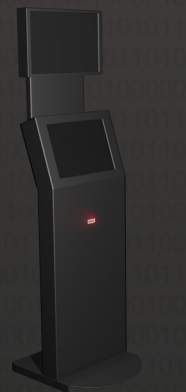
Lecteur code à barre/QRcode