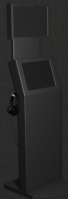
Casque audio renforcé